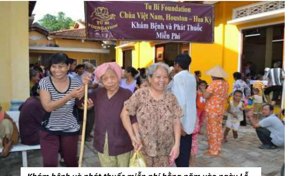
Khám bệnh và phát thuốc miễn phí hằng năm vào ngày Lễ Hội Quan Âm tại Việt Nam.